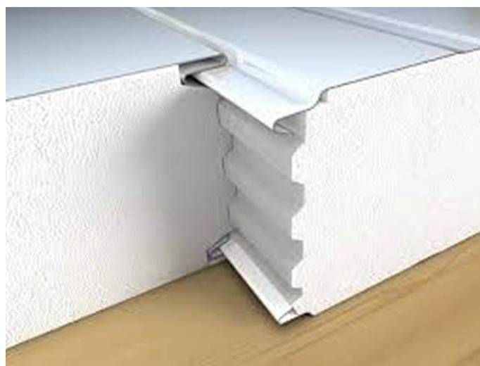
Encaixe macho e fêmea