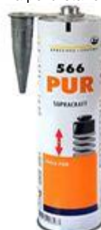
mastique com PU