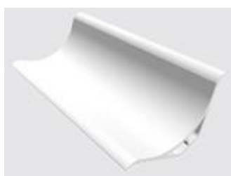
cantoneira arredondada pvc (sl)