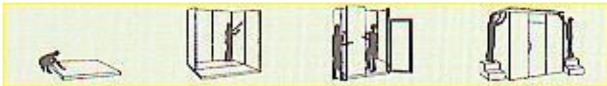
Sistema construtivo isotérmico pré-fabricado

Este bem rematado Catálogo Técnico aborda, não só os tipos, bem como as especificações técnicas dos Acessórios de Montagem para o Painel Frigorífico que fabricamos. Acresce que, estes apetrechos também são conhecidos pelo nome de material auxiliar. Por certo, eles são indispensáveis quando se tem por objetivo edificar utilizando o sistema construtivo isotérmico, seja para erguer uma pequena câmara frigorífica ou até um enorme galpão destinado ao crossdockig.