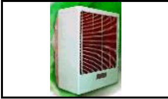
Resfriador evaporativo – Industrial