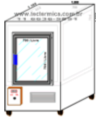
Câmara fria para congelamento rápido, ABP, Layout

Dispomos de uma linha padronizada de Câmaras frias para congelamento rápido , contado com equipamentos dimensionados para atingir a marca desejada em até 1 (uma) hora, de fácil operação e grande durabilidade.