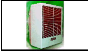
Resfriador evaporativo – Industrial